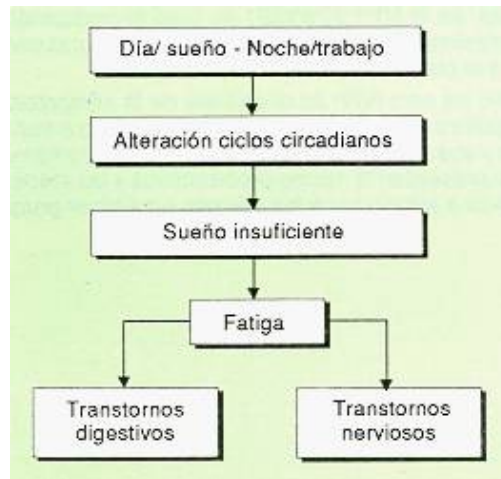
Fig. 1: Principales causas de alteración de las funciones psicofísicas

Estos tipos de trabajo conllevan unos determinados riesgos para la salud, potenciados por la perturbación de las funciones psicofísicas debidas a la alteración del ritmo circadiano, cuyas principales causas son los trastornos de sueño y las modificaciones de los hábitos alimentarios (Figura 1).